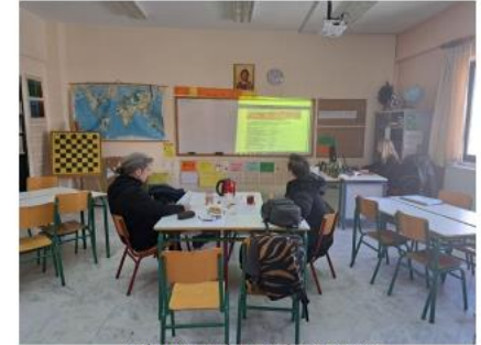
Εικόνα 1. 4η συνάντηση ομάδας mentoring