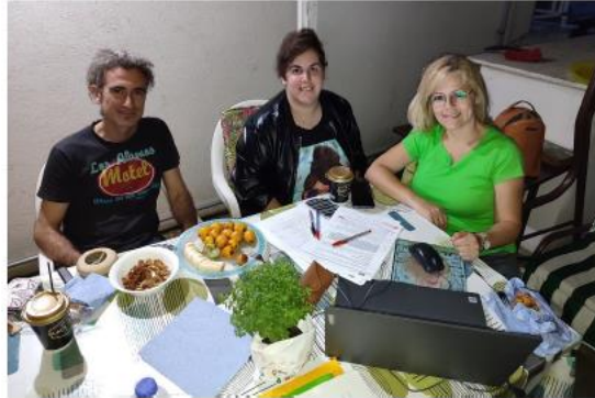
Εικόνα 9. Τελευταία συνάντηση της ομάδας mentoring